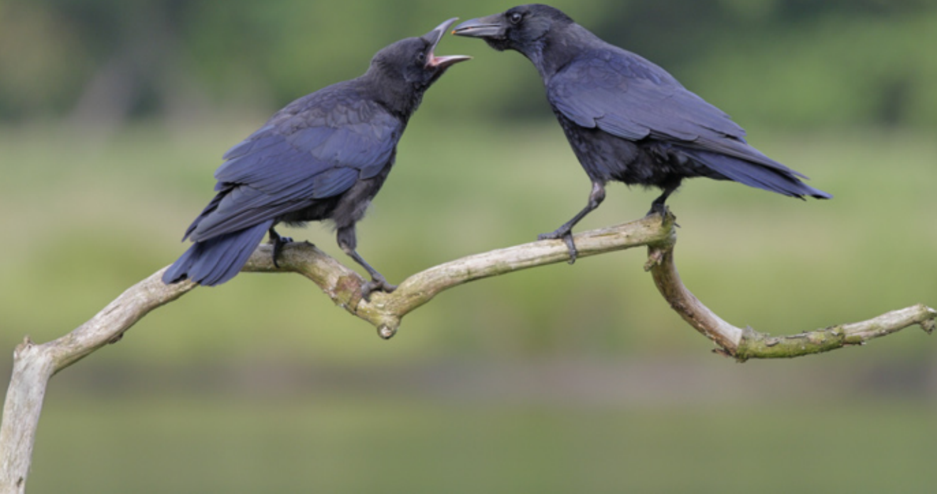
Oben: Bei der ersten Begegnung setzte ich mich auf den Waldboden und wartete.

Nikon Z6 | Nikkor AF-S 4/24-120 mm | 70 mm | 1/1.000 sec | f/4 | -1 LW | ISO 2.500